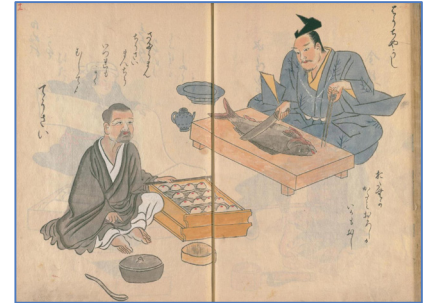
室町時代の饅頭売りの様子（左）。 伴信友『職人歌合画本』国立国会図書館デジタルコレクション https://dl.ndl.go.jp/pid/2551814