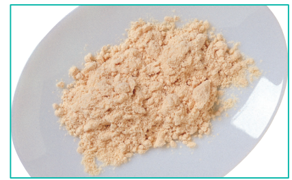
和三盆糖（わさんぼんとう）は、江戸時代からの伝統的な製法で作られる砂糖です。とても細かく、口どけがよいので、高級な和菓子に使われます。江戸時代後期に阿波国（現在の徳島県）、讃岐国（現在の香川県）で製造が始まりました。